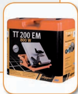
Упаковка - плстмассовый кейс