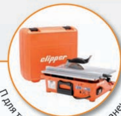
П для транспортировки и хранения