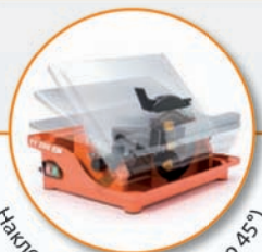
Наклоняемый стол (от 0° до 45°)