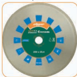
CLASSIC CERAM Ø 200 x 25,4 мм