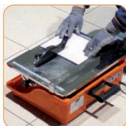
Точная направляющая резки