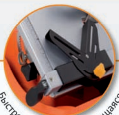
Быстро и точно закрепляющаяся направляющая для резки