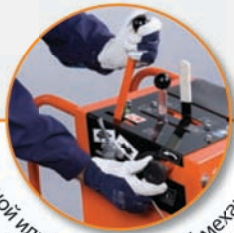
Ручной или гидравлический механизм опускания/подъёма диска