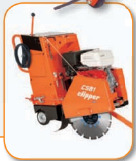
CSB1 Бензин 13 Л.С. (P13)