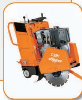
CSB1 Дизель 13 HP (D13 H1A)