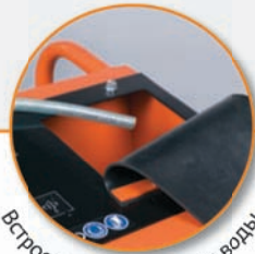
Встроенная емкость для воды