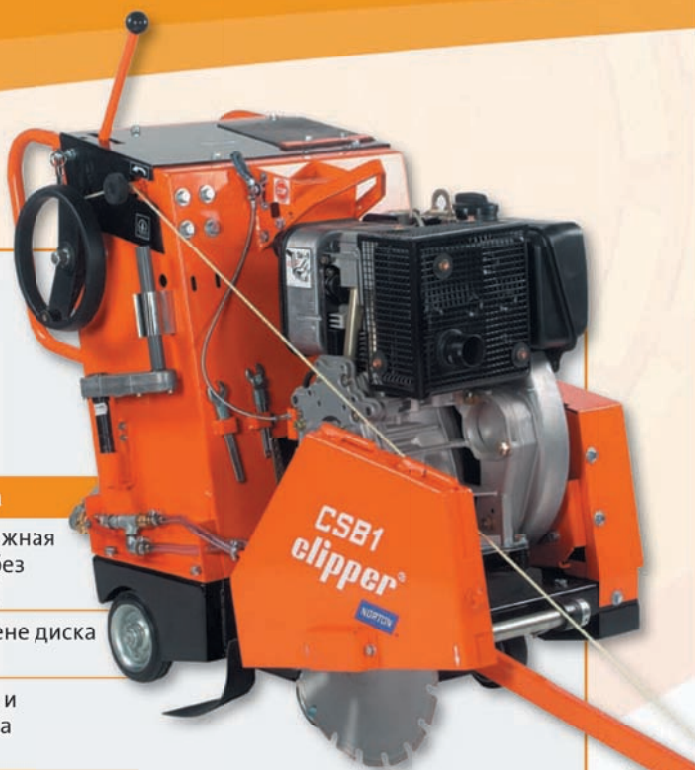
CSB1 Дизель 13 Л.С. (D13)