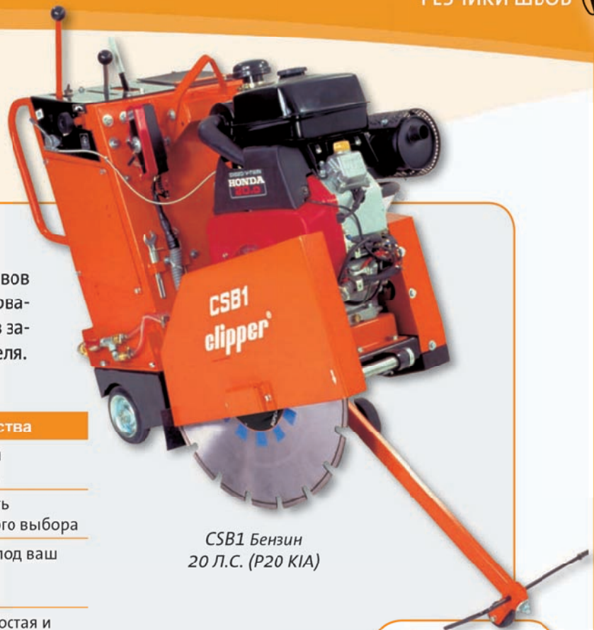
CSB1 Бензин 20 Л.С. (P20 KIA)