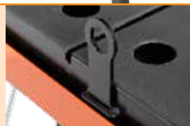
Система остановки конвейерного (роликового) стола