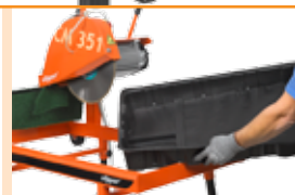
Съемный лоток для воды