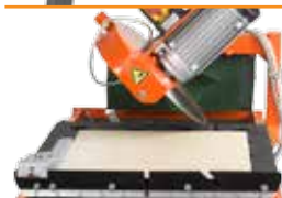
Наклонная головка и широкая 600 мм конвейерная тележка

Новый CM 351 – это легкий камнерезный станок с широкой конвейерной тележкой и поворачивающейся на 45° поворотной головкой для точной резки под углом.