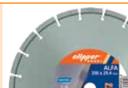
Машина поставляется с диском ClipperALFA Ø350 мм