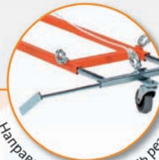
Направляющая -указатель резки на передней части рамы.