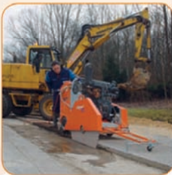
Эргономичные рабочие условия.