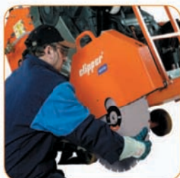
Простой доступ к диску.