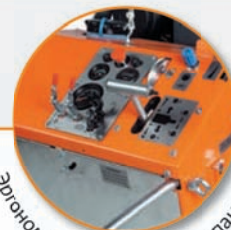
Эргономичная контрольная панель.