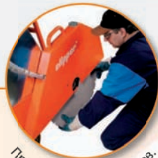
Простота замены дисков.

Высокая производительность Удобство при обслуживании Лучшая адаптивность к условиям окружающего рабочего пространства Для удобства использования Лучший контроль за резкой, что увеличивает срок службы алмазного диска Возможность корректировать направление движения машины Простая и точная установка